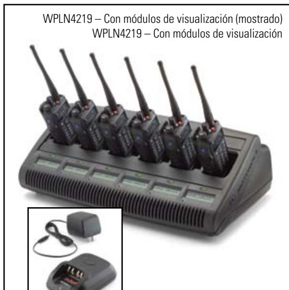
WPLN4219 – Con módulos de visualización (mostrado) WPLN4219 – Con módulos de visualización