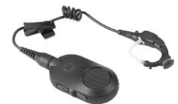
Auricular inalámbrico para operaciones esenciales

“Cuando vi por primera vez la Serie SL MOTOTRBO pensé que era un teléfono móvil, no una radio transmisora receptora. Tiene todas las capacidades de una radio transmisora receptora pero con un aspecto profesional y discreto que encaja a la perfección con todos nuestros uniformes”.