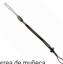
Correa de muñeca