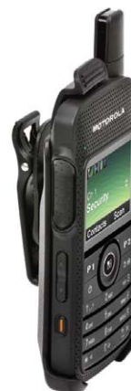
Soporte para transporte

Nuestro cargador único para múltiples unidades combina una elevada potencia con una gran imagen, permitiéndole cargar hasta seis radios o baterías al mismo tiempo. Es a la vez funcional y elegante en su diseño.