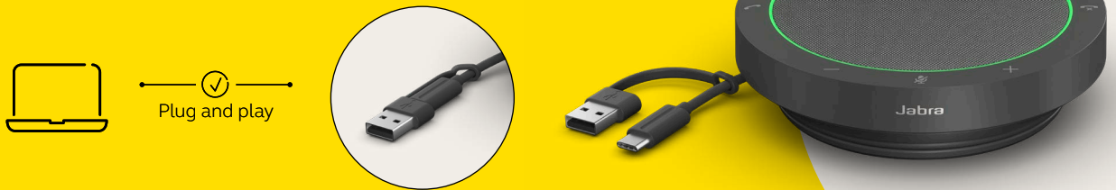
Conectores USB C y USB A incluidos

Conecta el cable USB a cualquier puerto USB C o USB A disponible en tu ordenador. El anillo LED de estado se iluminará en blanco para indicar que el altavoz está conectado y encendido.