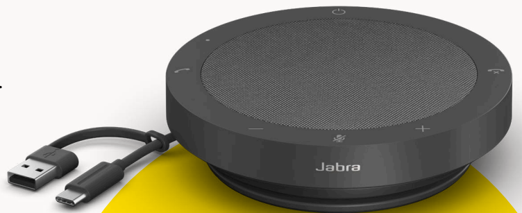
VARIANTES DE MS TEAMS Y UC

Para ayudar a cuidar nuestro planeta, tenemos presente la sostenibilidad cuidadosamente en cada etapa del desarrollo de un producto. La carcasa exterior del Speak2 40 se elabora con más de 50% de materiales sostenibles**, con una serie de piezas integradas que se pueden reparar o reemplazar. Mejor sostenibilidad = mayor vida útil del altavoz = llamadas de gran calidad para usted y su equipo durante muchos años.